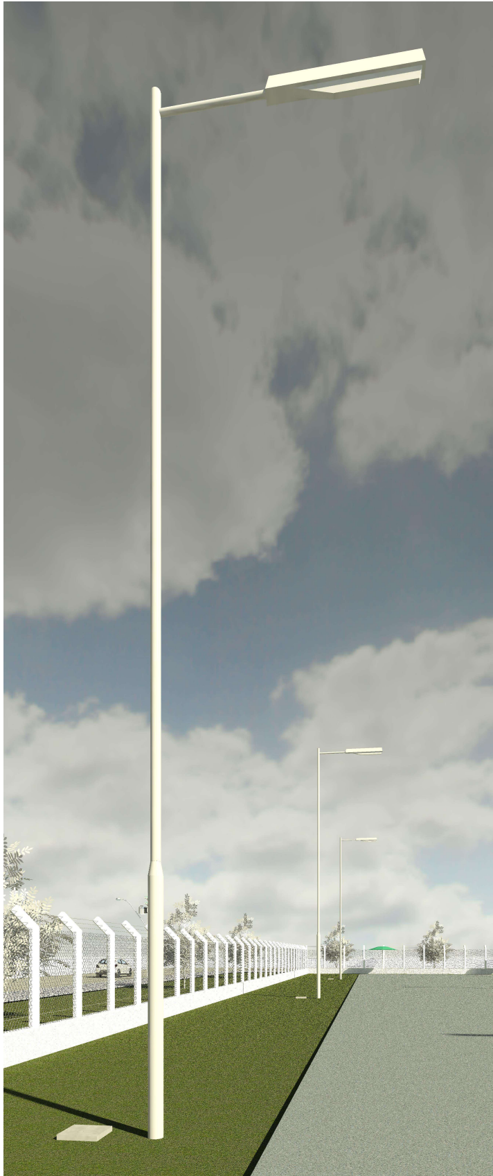
DETALHE DO POSTEAMENTO